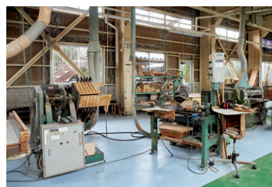
設備投資や職場環境改善で効率化

同社では、売上が増加している「アップライト」・「セピント」の更なる機能向上と生産量増加に向けて、最新の成形合板巾割機を導入している。従来同社で使用してきた巾割機に比べてより複雑な部品の切断が可能となる事で、部品数や工程の削減による生産リードタイムの短縮を図るとともに、より複雑な形状の椅子の製造技術も確立する事ができる。このように、業務効率化を図る設備更新も積極的に行いながら、常に新たな事へ挑戦し続けている。