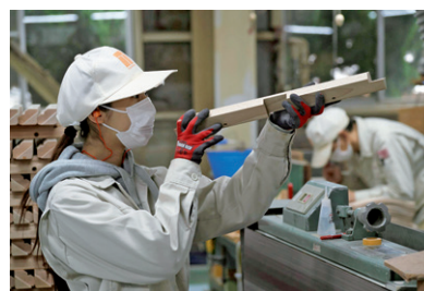
熟練工・若手・女性が力を合わせる

さらに、雇用面では地元高校・および女性新卒職工も採用し、雇用創出にも積極的に力を入れている。