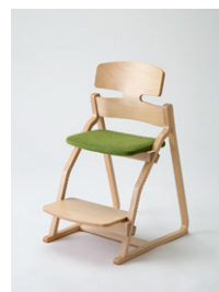
子どもたちの姿勢を守る椅子 「アップライト」

同社は、椅子をただ座るだけの物でなく、座ることで姿勢を守り、ひいては健康を守る物と捉え、新たな価値を創造している。特に、成長する子どもの姿勢を守りながら、大人になってもずっと使える椅子「アップライト」や、食事の姿勢を椅子で守ろうという発想から生まれた「セピント」は、同社が持つ成形合板製造の高い技術力と生産一貫体制、社外ディレクター、家具デザイナーと連携した自社ブランド構築と生産力向上が実現したことで完成した、同社の人気製品である。